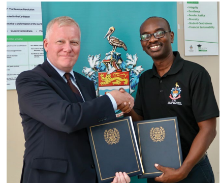
Five Islands Campus, University of the West Indies, Antigua-et-Barbuda