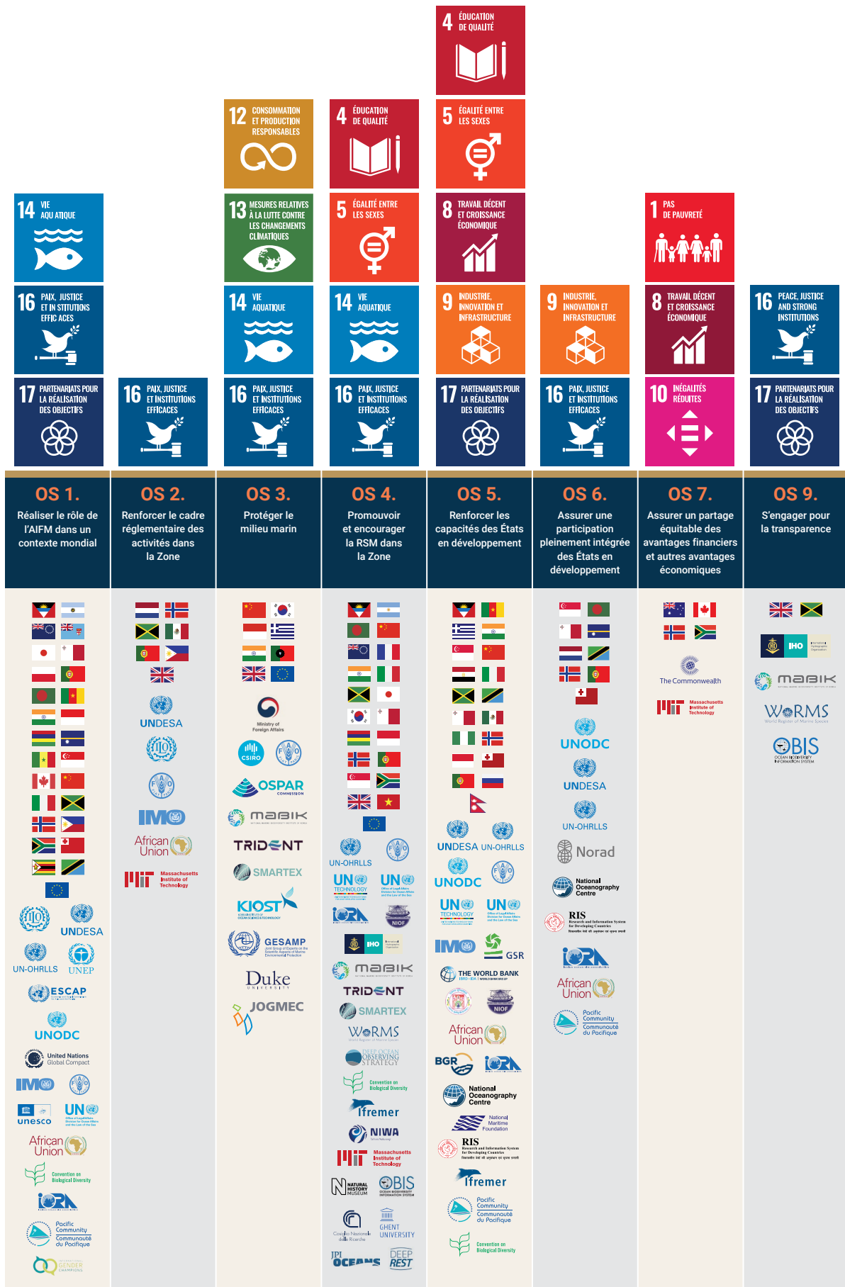
Figure 4. Partenariats stratégiques de l'AIFM et leur contribution aux orientations stratégiques de l'AIFM