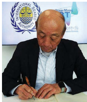
Ocean Mining Roundtable